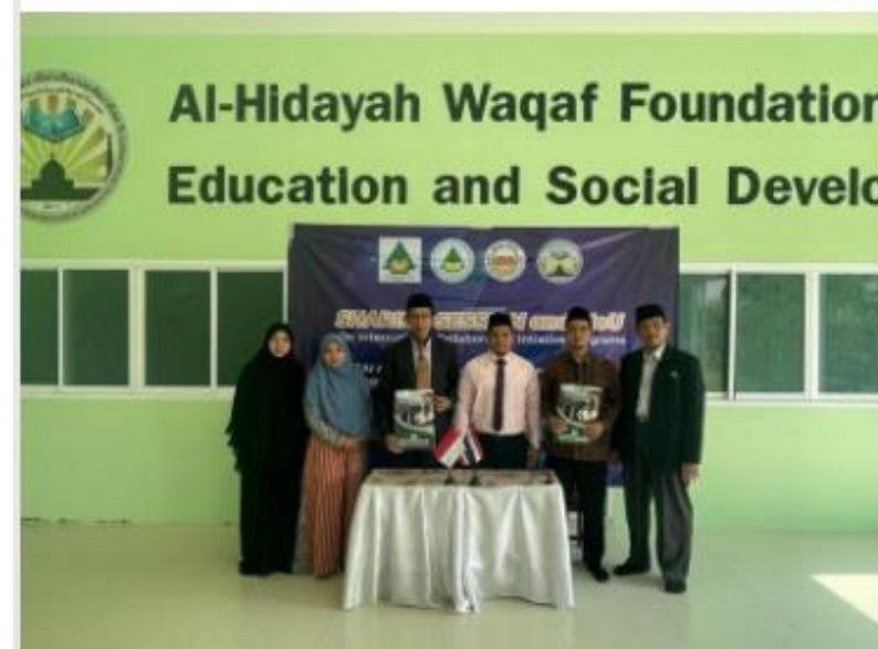
PERLUAS JARINGAN INTERNASIONAL. STAIMA Al-Hikam Malang menjalin kerja sama dengan Al-Hidayah Waqaf Foundation di bidang pendidikan dan sosial.