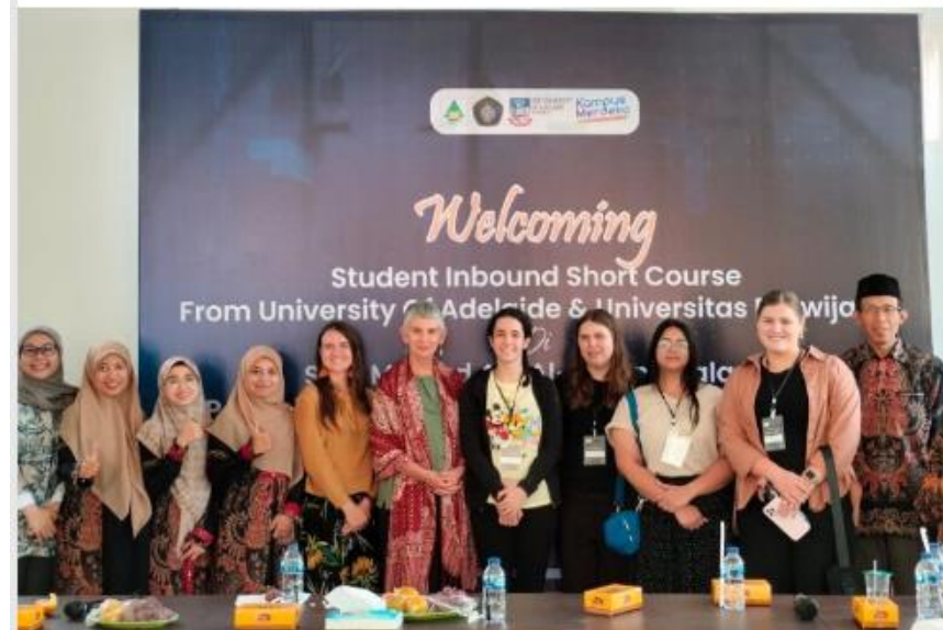
JUNJUNG TOLERANSI. Kunjungan Adelaide University Australia dan Universitas Brawijaya ke STAIMA Al-Hikam Malang.