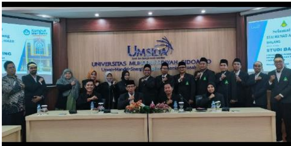
PENGELOLAAN LEMBAGA. Kunjungan STAIMA Al-Hikam Malang untuk melakukan studi banding ke Universitas Muhammadiyah Sidoarjo, Rabu (10/5/2023).