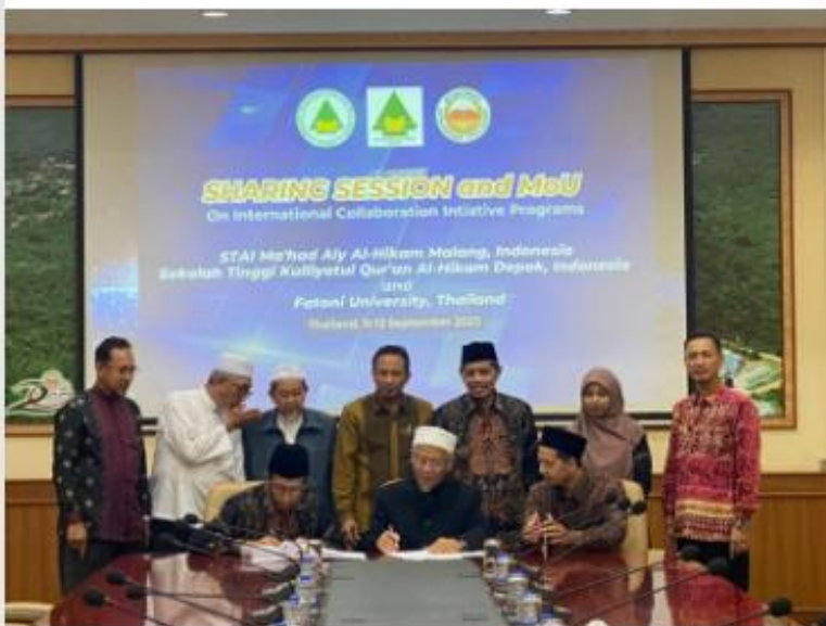
PERLUAS JARINGAN LUAR NEGERI. Penandatanganan MoU STAIMA Al-Hikam Malang ibngan Fatoni University Thailand.