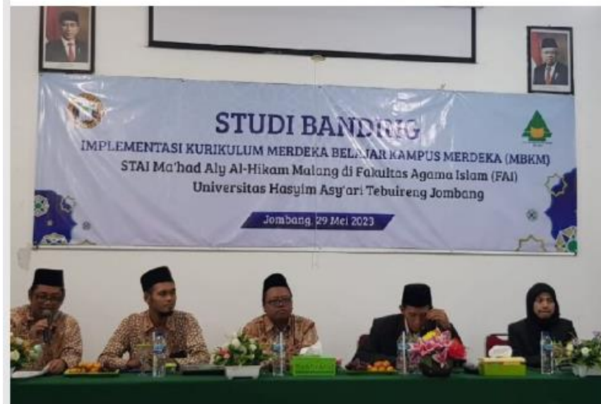
STUDI BANDING. Kunjungan STAI Ma'had Aly Al-Hikam Malang ke Universitas Hasyim Asy'ari (UNHAS Y), Tebuireng, Jombang, Senin (29/5/2023).