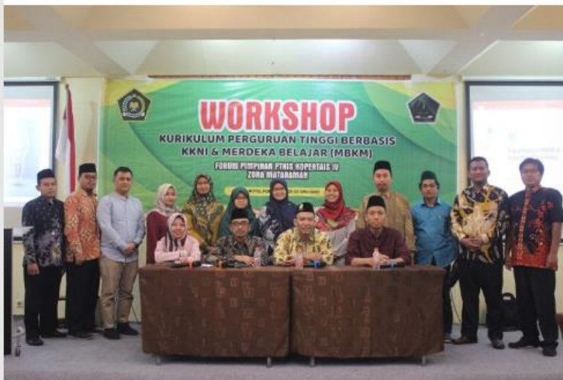
PERKOGOH KURIKULUM MERDEKA BELAJAR. Para peserta workshop PTKIS Wilayah Kopertais IV Zona Mataraman di Ponorogo.